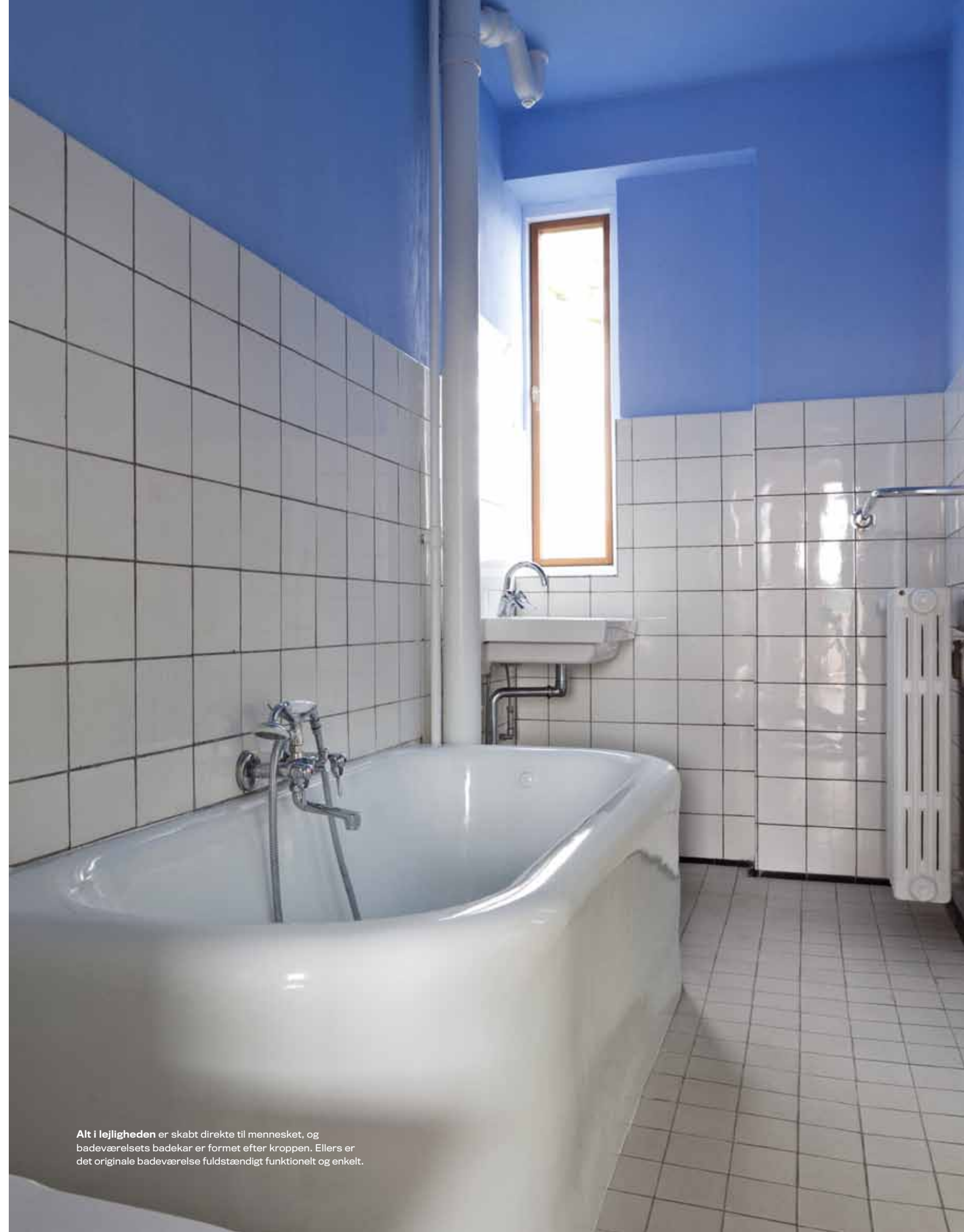
Alt i lejligheden er skabt direkte til mennesket, og badeværelsets badekar er formet efter kroppen. Ellers er det originale badeværelse fuldstændigt funktionelt og enkelt.